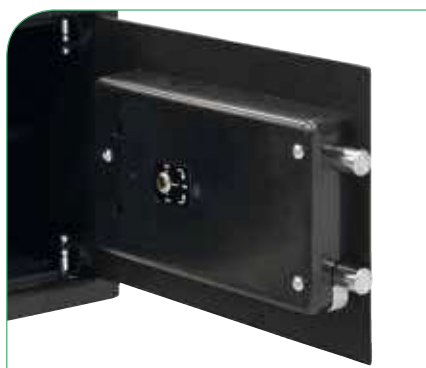
Opcional: gestión de alquiler mediante llave de serreta.