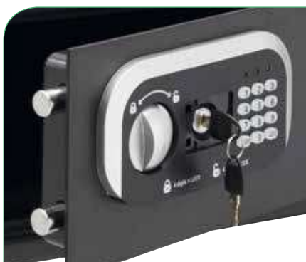
Llave mecánica para aperturas de emergencia.