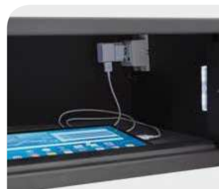
Opcional: enchufe interno.