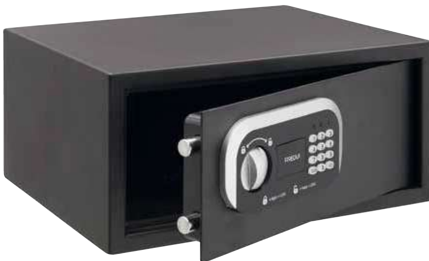
ECO RESORT Ref. S3