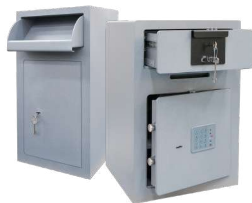
Serie Jade. Seguridad, versatilidad y cuidado diseño